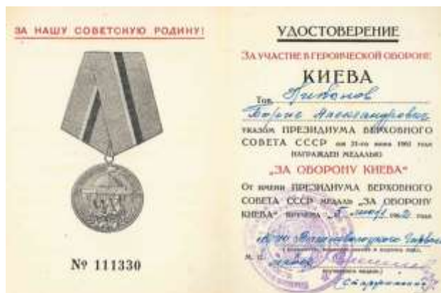
Фото 4. С сайта «Подвиг народа». [1]

Был награжден медалью «За оборону Киева».