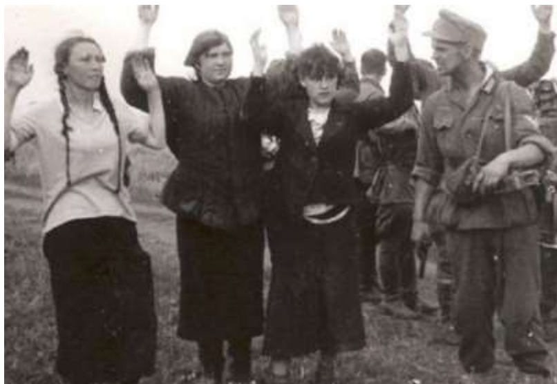
Фото 11. [4]

По дороге собирали под обстрелом мерзлую картошку на полях и ели ее. Дойдя до г. Дно Псковской области их приютила на ночь местная жительница, спали на кухне под столом, а на столе лежал свежесвепеченный хлеб, но она им не дала ни кусочка. Переночевав двинулись дальше по Псковской области, как-то по дороге ехала машина с немцами, ка вспоминала прабабушка: «Страшно было до смерти, но мы стояли как вкопанные, от ужаса и немцы нас не тронули, а кинули пачку макарон». Удалось дойти до г. Пустошка Псковской области. Там в октябре 1941 года она с подругами попала в плен к немцам. Ее определили работать на кухне при немецкой воинской части. В марте 1942 года с г. Пустошка ее и еще много местных жителей интернировали (принудительно) вывезли на работы в Германию.