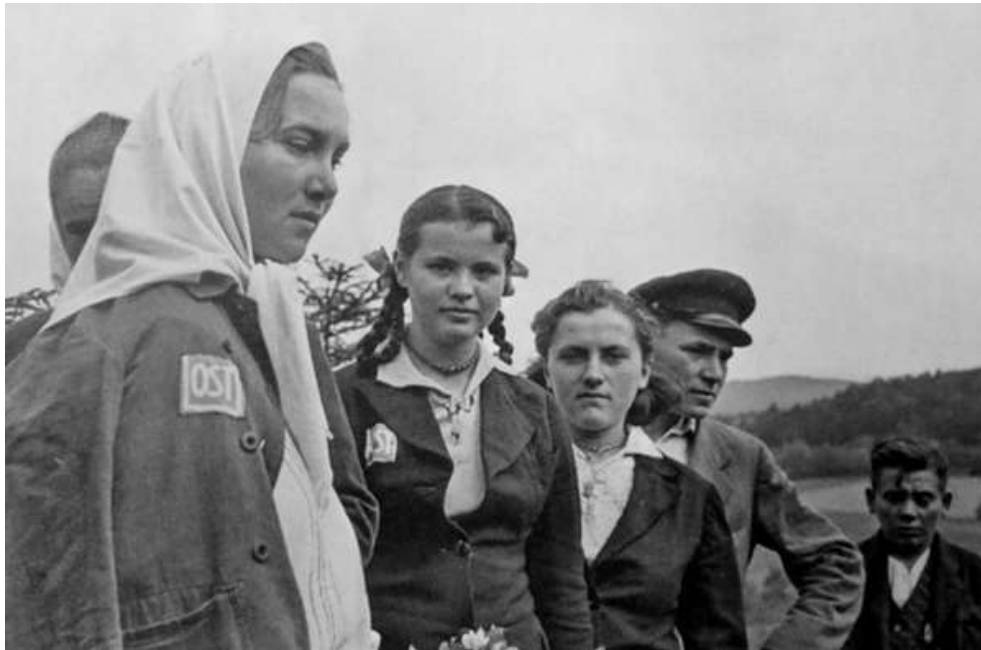
Фото 14. С сайта «Та сторона». [3]