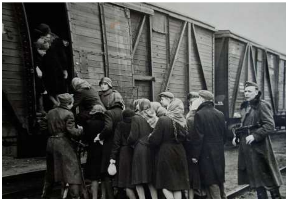
Фото 12. [4]

Везли в Германию в товарных вагонах, дорога превращалась в череду унижений. У каждого пленного на груди была нашита бирка с надписью «OST», наглядно свидетельствующий об унижительном и бесправном статусе этих людей.