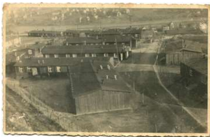
Фото 13. [8]

Жили в типичном рабочем лагере с бараками, обнесенные колючей проволокой, спали на соломенном матрасе.